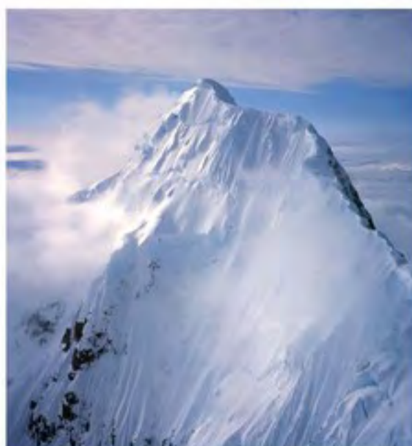
Mt. Huntington - velkolepá horolezecká výzva v oblasti Denali

kouty zeměkoule jsme s kamarády poprvé zažívali pocit, že jsme našli místo na světě, kde se otisky člověka rozptýlily v tak velkém a divokém prostoru, že jsou téměř neznatelné. Naopak stopy v našich srdcích tato země zanechala hlubší, než jsme čekali.