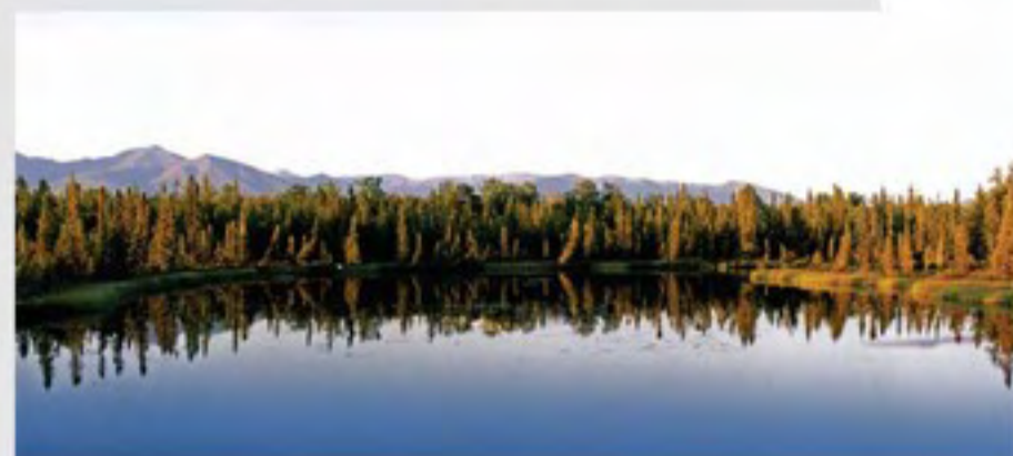
Poloostrov Kenai pokrývá obrovské množství jezer všech velikostí