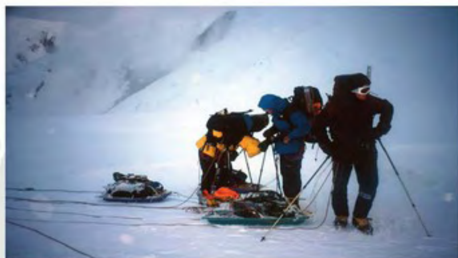
K aljašskému horolezectví neodmyslitelně patří vyčerpávající přesuny po ledovcích