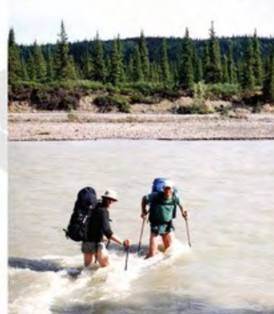
Jakmile člověk s patnáctikilovým batohem ztratí kontakt se dnem, stane se kusem dřeva hozeným do divoké vody Teklaniky

Tak tady byl ten konec Chrise a možná teď i našeho putování! „Snad tady neskončíme, to nemůže být pravda!“ Je přece nízký stav vody, naši nemnozí předchůdci se také přes řeku museli dostat. Opatrný optimismus nahrazuje beznadějí a začínáme velmi zvolna hledat pravděpodobný brod. Vybíráme místo, kde jsou koryto řeky i jednotlivá ramena nejširší a tedy teoreticky s nejmenší hloubkou. Postupně se střídavě přes vodu a suché štěrkové náplavy dostáváme až k hlavnímu toku, za nímž je již kýžený