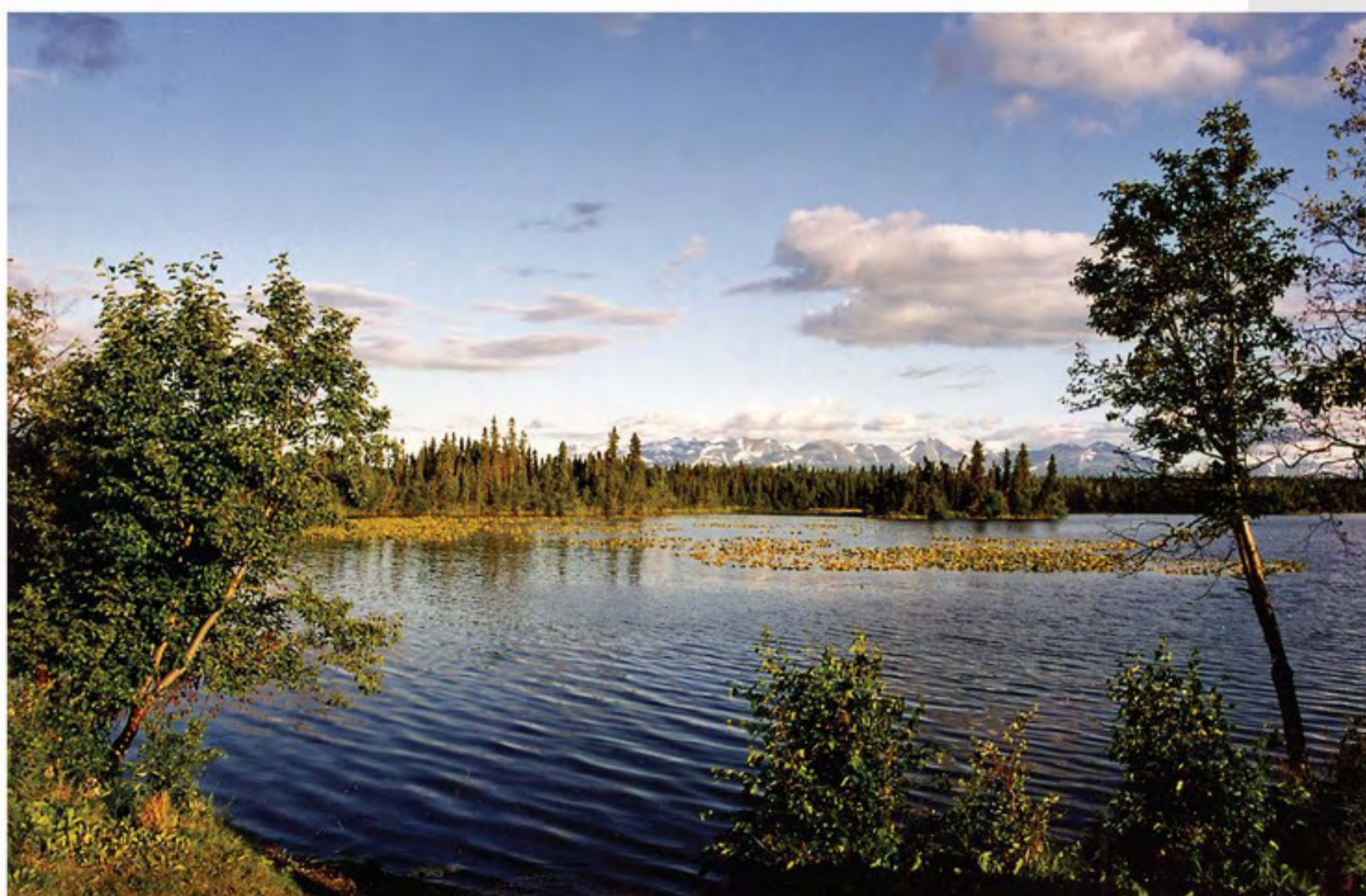
Kelly Lake v 10 hodin večer - poloostrov Kenai

Na Aljašku jsme vyrazili s rozporuplnými pocity. Po horolezeckém výstupu na McKinley jsme si naplánovali měsíc a půl trekkingu a cestování aljašskou divočinou. Čekali jsme krásnou, leč jednotvárnou přírodu, hejna komárů, zimu, šedivou oblohu a Američany s konzumním životním stylem. A vrátili se s pocitý modrého nebe a neuvěřitelné a nepoznamenané divočiny – na každém kroku rozmanité a překvapující. Vrátili jsme se z krajiny, kde slunce svítí o půlnoci, z krajiny drsných mužů, stříbrných lososů, polárních září a medvědích steaků. Z krajiny zlata i bídy, radosti i lidských tragédií. Vrátili jsme se s radostí, že civilizace v tomto odlehleém koutě světa ještě nestihla naučit potomky Eskymáků kultuře hamburgerů a Coca-Coly.