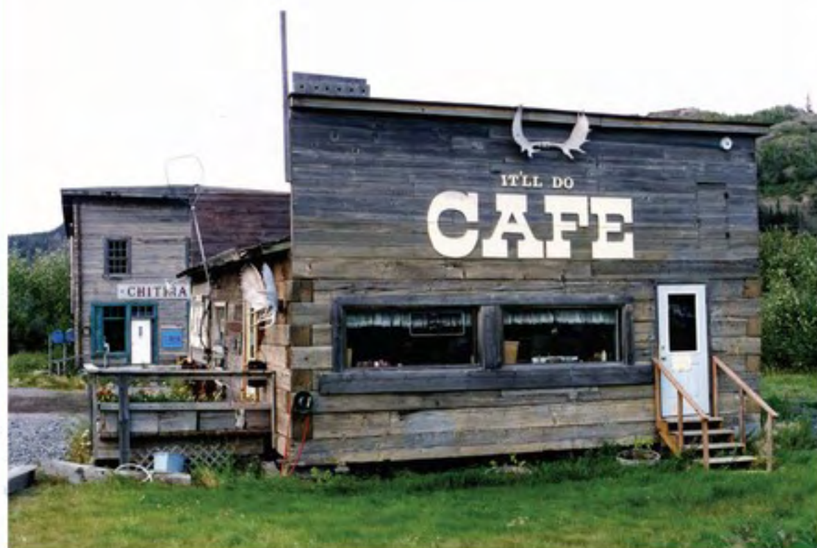
Kavárna v Chitině